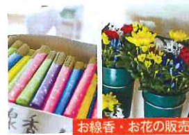
お線香・お花の販売