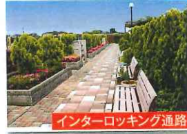
インターロッキング通路